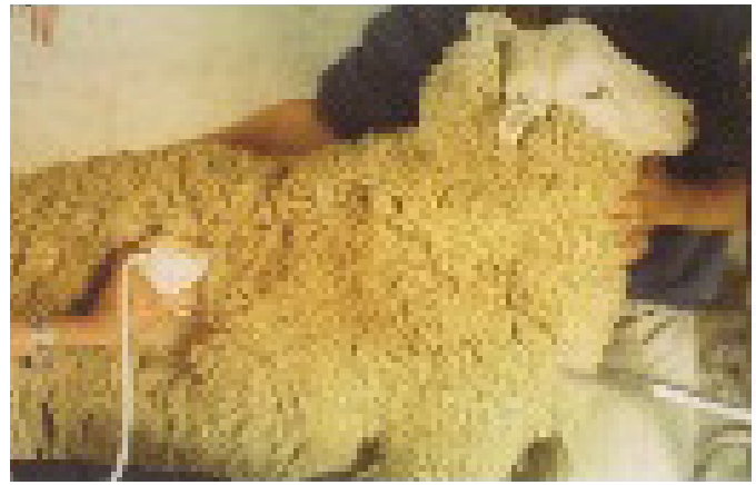
Figura 4. Magrario con 6 meses de edad con evaluación del L. dorsi por ultrasonido

Con respecto a las variables de biomasa para M y HD los valores del peso al finalizar el período fueron similares al igual que los valores de AMDr. En los valores obtenidos sobre el L. dorsi se encontraron nuevamente diferencias altamente significativas entre M y HD para GS y GP evidenciando que, si bien ambos genotipos alcanzan el