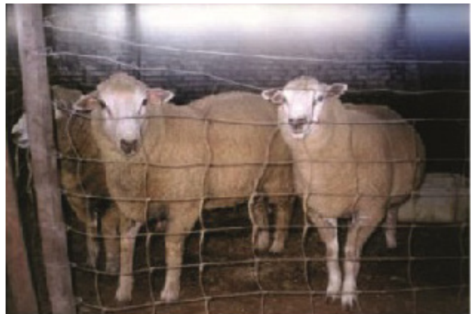
Figura 5. Magrario al finalizar el confinamiento posdestete de dos meses

mismo peso, HD lo hace aumentando su tenor de grasa. Es de destacar que todos los genotipos fueron igualmente eficientes bajo estas condiciones ambientales tal como se refleja en la estimación de eficiencia a través del AMDr. Si bien el peso final que alcanzan los corderos M resultó similar a los HD, indicando que estos corderos tendrían igual biomasa, las diferencias estarían en los tenores de grasa detectados por la metodología del ultrasonido. Según estas observaciones los corderos M resultarían más eficientes para convertir el alimento en proteína más que en grasa (Relling et al. , 2010).