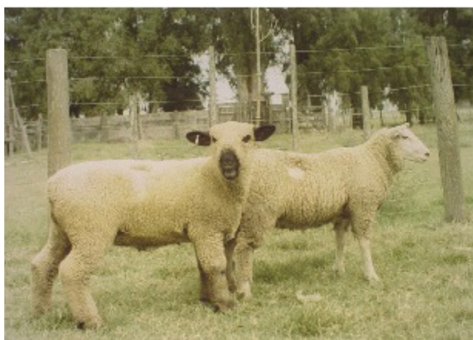
Figura 6. Corderos F_1 (MxHD) y Magrario después de dos meses de confinamiento posdestete

Otro análisis que permitió ubicar a las cruzas con respecto a los genotipos M y HD en su rendimiento se obtuvo con un análisis de conglomerados. Este análisis multivariado, con todos los caracteres evaluados, permitió determinar la ubicación de las cruzas respecto de los progenitores M y HD en distintos agrupamientos. En estos dendrogramas pudo observarse que el genotipo M, tanto en corderos machos como hembras, se diferencia de los restantes genotipos siendo mayor la distancia observada con corderos machos HD. La conformación de los grupos que este análisis permitió obtener demostró que los genotipos cruza se ubican cercanos a M, especialmente las cruza donde M es progenitor (Figura 8). La correlación cofenética fue de 0,85 para machos y 0,80 para hembras; si bien para este sexo el genotipo más distante de M fue la cruce IxHD y la más cercana MxHD. La visualización de esta conformación grupal justificaría el supuesto de que el genotipo Magrario actuaría con una acción génica semidominante en combinación con los otros genotipos raciales en este estudio.