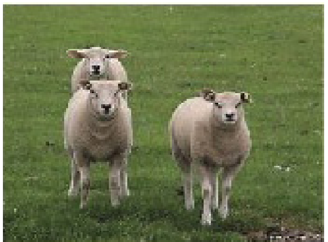
Figura 3. Raza Texel

genética de la Merino (Gines, 2007) y se originó en la isla Texel situada en el noroeste de Holanda. Al final del siglo XIX un reducido núcleo de esta raza fue cruzada con las razas inglesas Lincoln y Leicester con el fin de obtener un tipo de animal de bajo tenor de grasa en la carcasa. Actualmente se la reconoce por esta cualidad y se ha difundido en Europa como raza terminal para producir carcasas de carne magra (Leymaster y Jenkins, 1993; Visscher, 2000). Al continente americano llegó con su introducción en Uruguay hace más de 40 años y desde ahí llega a nuestro país introduciéndose como raza productora de carne en la Pampa Húmeda y el alto valle del Río Negro (Figura 3).