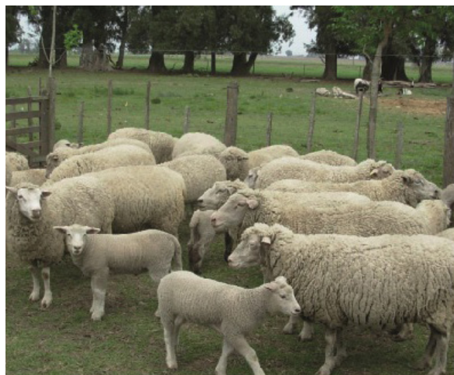
Figura 7. Madre y cordero Magrario (izq.) – Madre Ideal con cordero (IxM) (der.)