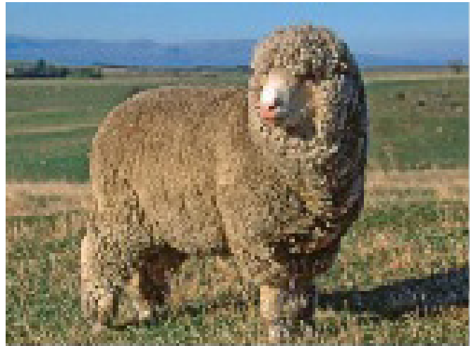
Figura 2. Raza Ideal (Polwarth)

En los últimos años se ha introducido en el país la raza Texel, reconocida como raza esencialmente productora de carne de calidad. Esta raza proviene de un grupo de ovejas de cola corta que tiene una marcada distancia